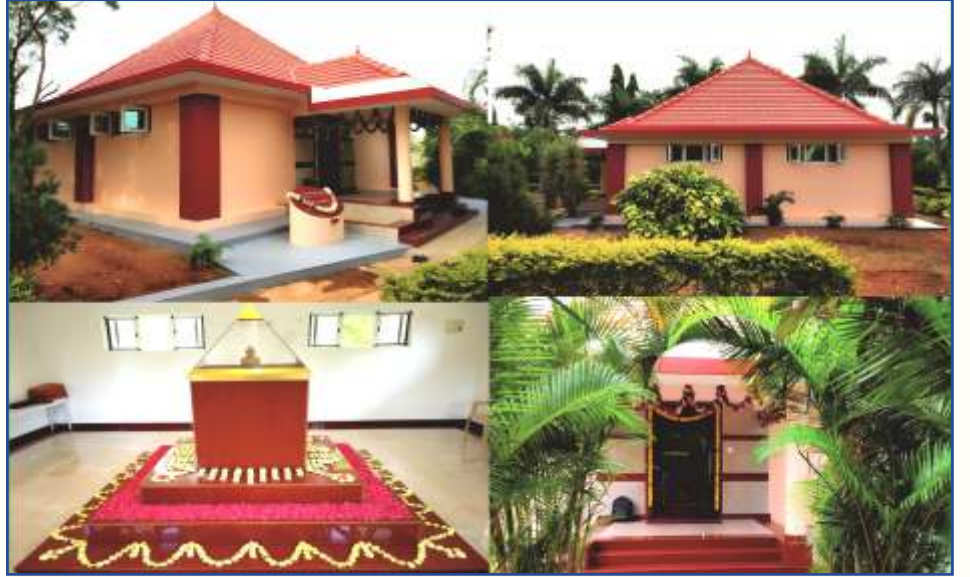
ನವೀಕರಣಗೊಂಡ ಗುರುಜಿಯವರ ಸಮಾಧಿ ಮಂಟಪವನ್ನು ಅಕ್ಟೋಬರ್ 18, 2020ರಂದು ಉದ್ಘಾಟಿಸಲಾಯಿತು.

ನಿಮ್ಮ ಸ್ನೇಹಿತರಿಗೆ ತಪೋವಾಣಿಯನ್ನು ಉಡುಗೊರೆಯಾಗಿ ಕೊಡಿ. ವಾರ್ಷಿಕ ಚಂದಾ ದೊಂದಿಗೆ ಅವರ ಹೆಸರು ಮತ್ತು ವಿಳಾಸವನ್ನು ನಮಗೆ ಕಳುಹಿಸಿ.