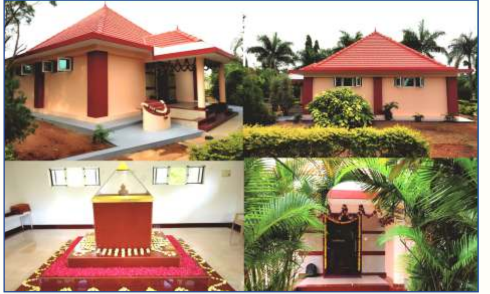
नूतनीकरण केलेल्या तपोवनातील गुरुजींच्या समाधी हॉलचे १८ ऑक्टोबर २०२० रोजी उद्घाटन करण्यात आले.

आपल्या मित्राला भेट करावे. वर्गणी सोबत, त्यांचं नाव व पत्ता आमच्याकडे पाठवावा.