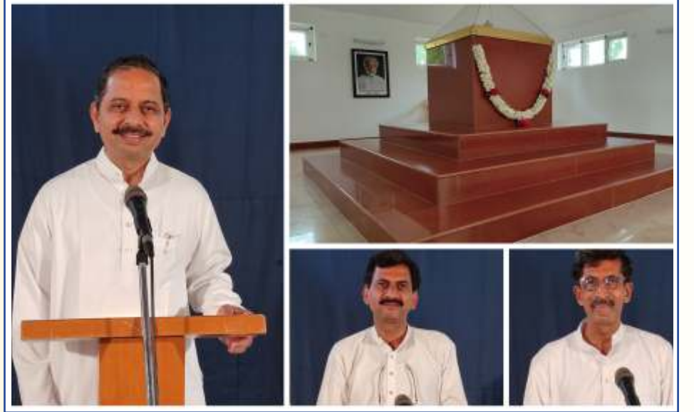
२३ मे २०२१ रोजी गुरुजींची ८२वी जयंती साजरी करण्यात आली.

आपल्या मित्राला भेट करावे. वर्गणी सोबत, त्यांचं नाव व पत्ता आमच्याकडे पाठवावा.