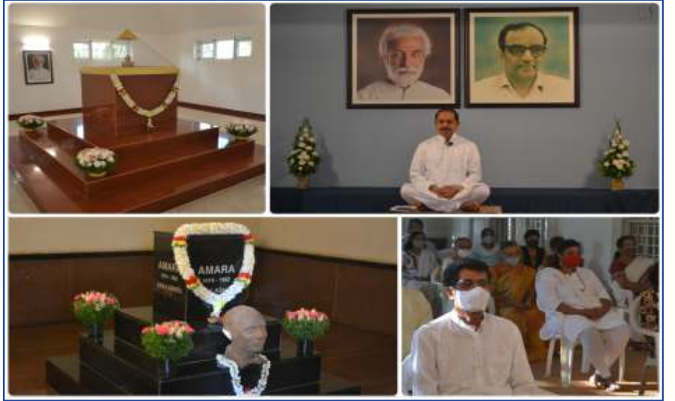
ಫೆಬ್ರವರಿ 1ರಂದು, 11ನೇ ವಿಶ್ವ ಚಾನೆಲ್ ದಿನದ ಪ್ರಯುಕ್ತ, ಲೈವ್ ಲೈಟ್ ಚಾನೆಲಿಂಗ್ ಸೆಷನ್‌ಗಳನ್ನು ತಪೋನಗರದಲ್ಲಿ ನಡೆಸಲಾಯಿತು.

ನಿಮ್ಮ ಸ್ನೇಹಿತರಿಗೆ ತಪೋವಾಣಿಯನ್ನು ಉಡುಗೊರೆಯಾಗಿ ಕೊಡಿ. ವಾರ್ಷಿಕ ಚಂದಾ ದೊಂದಿಗೆ ಅವರ ಹೆಸರು ಮತ್ತು ವಿಳಾಸವನ್ನು ನಮಗೆ ಕಳುಹಿಸಿ.