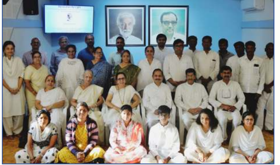
१३ मार्च रोजी १२व्या 'वर्ल्ड चॅनल्स डे' चे यश साजरे करण्यासाठी प्रकाश प्रवहन स्वयंसेवक तपोनगरात एकत्र जमले.

आपल्या मित्राला भेट करावे. वर्गणी सोबत, त्यांचं नाव व पत्ता आमच्याकडे पाठवावा.